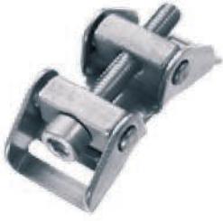
Vida kilidi 18 mm